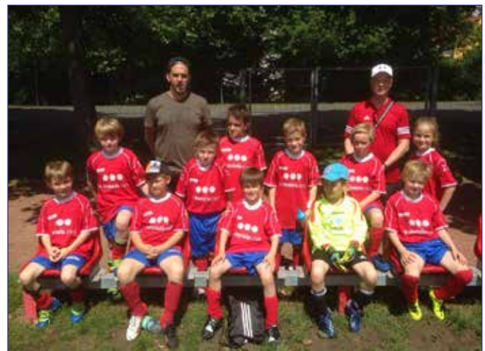
Gruppenfotos beider F-Jugenden nach den Heimspielen am letzten Spieltag