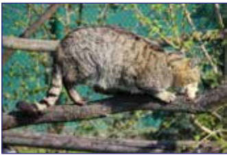
Luchs beim Beutefang

Weitere besondere Erlebnisse erwarten uns am folgenden Tag am Südrand des Hainichs. Zu Beginn informieren wir uns in einer Ausstellung im Wildkatzenort Hütcheroda über die Lebensweise der scheuen Waldtiere, die wir dann danach in einem Gehege in natura bei einer Fütterung kennen lernen.