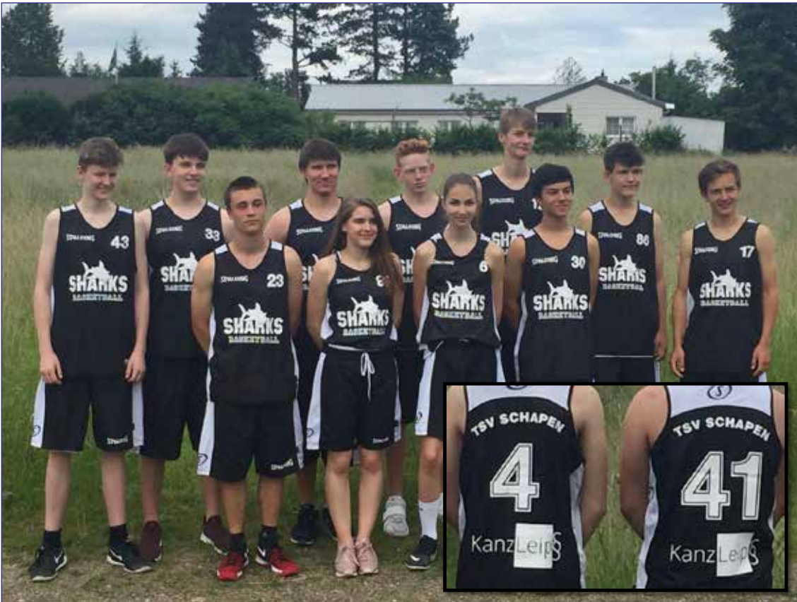
Die U18-Mannschaft der Schapen Sharks in ihren neuen Trikots.