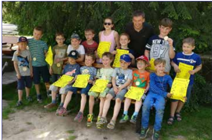
Gruppenfoto mit Urkunden nach Abschluss der Zoorallye in Essehof

In der Anfang des Jahres laufenden Hallenrunde haben uns sehr passabel präsentiert und wie geplant weitere neue Spieler in das Team integriert. Abschluss der Hallensaison bildete das eigene Turnier in der Ricarda-Huch-Halle. Neben zwei Teams unserer G-Jugend nahmen Mannschaften aus Ölper, Weddel-Schapen, Lamme und Völkenrode teil. Vielen Dank an dieser Stelle noch mal an alle Helfer, ohne deren Unterstützung ein solches Turnier nicht erfolgreich über die Bühne gehen kann.