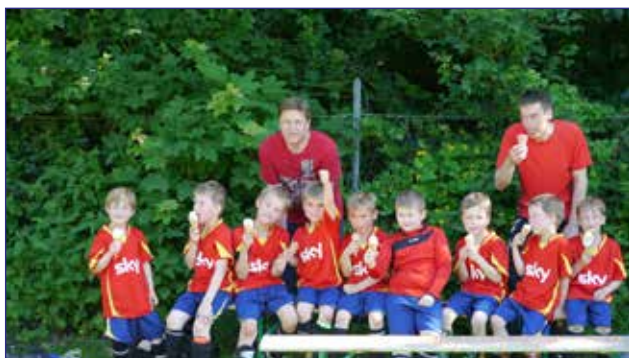
Gemeinsames Eis-Schlecken nach der letzten Spielrunde in Ölper

Der Neuaufbau der G-Jugend hat bereits begonnen. Weitere Spieler der Jahrgänge 2011/12 sind herzlich willkommen, gleichfalls mindestens ein weiterer Fußballbegeisterter, der zukünftig beim Training unterstützen wird! Sprecht mich bei Interesse gerne an.