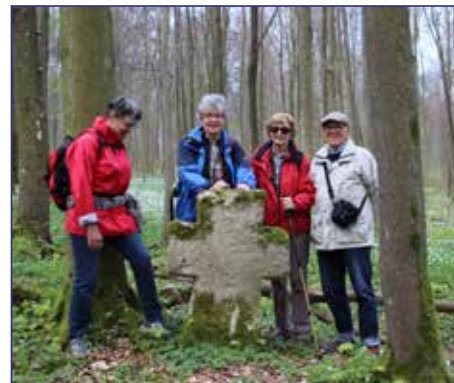
Stein an einer Mordstelle

Aber auch geschichtsträchtige Orte, die an frühere Herbergen und wüst gefallene Siedlungen erinnern, werden passiert. Historische Steinkreuze und Grenzsteine, sehenswerte originale Wegweiser, frühgeschichtliche Bodendenkmäler liegen am