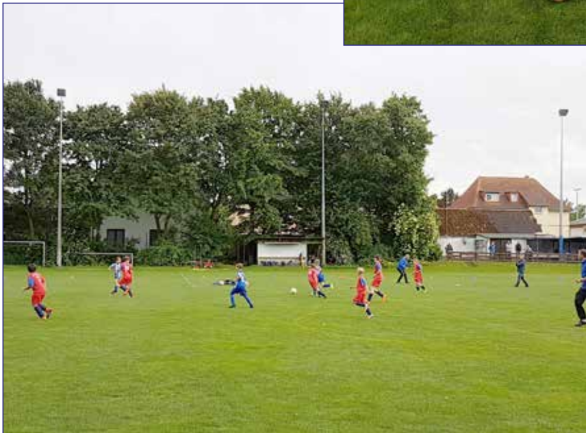
Szene aus dem letzten Saisonspiel gegen Lehndorf IV. Die räumliche Aufteilung unserer Mannschaft ist gut zu erkennen. Dementsprechend gewannen wir das Spiel mit 6:2

chen Jahrgangs. Nach dann drei Siegen in Folge, unter anderem auch gegen Polizei 1, hatten wir das Hinrundenziel zweiter Platz selbst in der Hand. Aufgrund fehlender Konstanz /fehlendem Selbstbewusstsein und zwei Unentschieden in den letzten beiden Spielen gegen vermeintlich schwächere Gegner verfehlten wir das Ziel um einen Punkt und wurden nur Vierter.