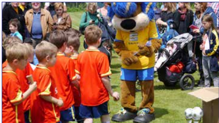
Timmerlah - Medaillenübergabe durch das Eintracht Maskottchen Leo

Aufgrund der gezeigten guten Leistungen gab es nach der letzten Spielrunde auch zu Recht ein Eis für unsere Kicker.