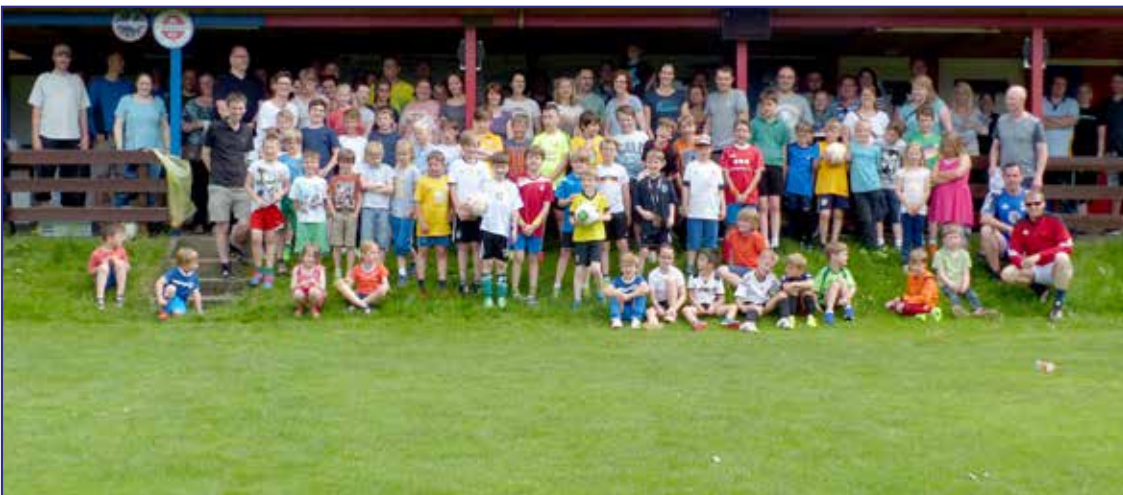
Gemeinsames Gruppenfoto – Saisonabschluss