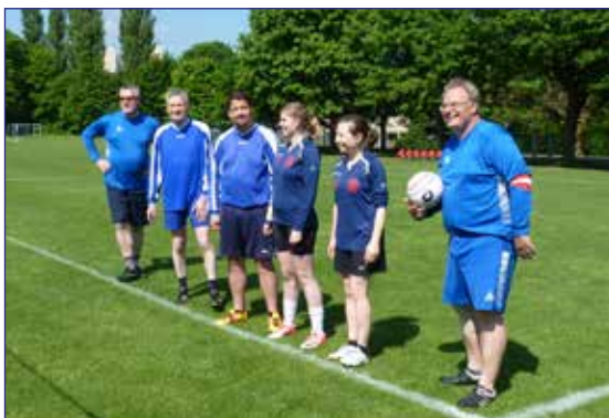
SCE 2 Gliesmarode

Dass es schwierig wird, den erfolgreichen 1. Spieltag nochmal zu toppen, war klar. Trotzdem hielt das auf vier Positionen veränderte Team des SCE Gliesmarode II auch am 2. Spieltag gut mit. Der spätere Bezirksmeister vom MTV Salzgitter II musste schon alle Register ziehen, um sich durchzusetzen. Mit 0:2 (13:15, 6:11) ging das Spiel nur hauchdünn verloren. Der MTV Vorsfelde II spielte diesmal mit deutlich weniger Eigenfehlern und so ging die Partie verdient mit 2:0 (11:7, 11:4) an die Wolfsburger. Ein spannendes Spiel gab es gegen den MTV Lauterberg. Den 1. Satz gewann der SCE mit 12:10. Die Lauterberger glichen mit 11:7 aus und sicherten sich schließlich auch den Entscheidungssatz mit 11:8. Der SCE II beendet die Saison auf dem 3. Tabellenplatz hinter Meister Salzgitter und Vorsfelde.