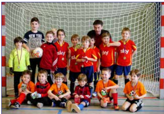
Teamfoto nach der Medaillenübergabe

feier mit traditionellem Eltern-gegen-Kind-Spiel haben wir die Saison mit einem Turnier in Timmerlah beendet. Hier konnten wir nach den beiden Niederlagen gegen die späteren Endspielteilnehmer gleich zu Turnierbeginn alle weiteren Spiele für uns entscheiden. Zur Belohnung gab es natürlich wieder die heißersehten Medaillen für alle teilnehmenden Kids – übergeben durch das Eintracht Maskottchen Leo.