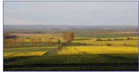
Blick von der Terrasse unseres Quartiers

das im Hainich einzigartige Ökosystem aufgeklärt. Im Gebäude des Nationalparkzentrums besuchen wir danach zwei großräumige Erlebnisbereiche. Die „Wurzelhöhle“ präsentiert Skurriles und Wissenswerten aus dem Leben unter der Erdoberfläche und die „Entdeckerausstellung“ informiert mit interaktiven Vorführungen und Modellen über die Besonderheiten des Nationalparks. Eine kleine Gruppe wandert dann vor der „Heimfahrt“ noch auf einem Naturpfad durch das abwechslungsreiche umgebende Waldgebiet u.a. vorbei an der „Alten Eiche“, dem mit 5,45 m dickstem Baum im Nationalpark.