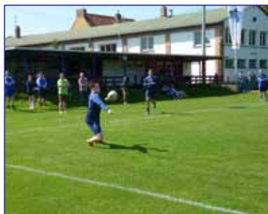
Matteo Kaminski, Verbandsliga Gliesmarode

Am 3. Spieltag ging es noch einen Platz höher. Mit einem souveränen 2:0-Auswärtserfolg (11:7, 11:8) im Derby gegen den TuS Essenrode II kletterten die Faustballer des SCE Gliesmarode auf den 3. Tabellenplatz der Verbandsliga. Das Rückspiel gegen den ungeschlagenen Tabellenführer vom MTV Salzgitter ging mit 0:2 (8:11, 9:11) verloren. Mit vier Punkten Vorsprung auf die Abstiegszone, hatte es der SCE 1 selbst in der Hand, am letzten Spieltag den Klassenerhalt dingfest zu machen.