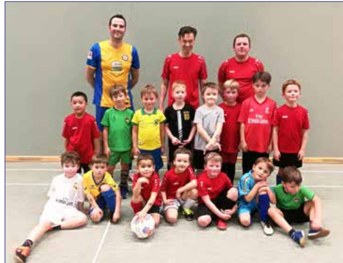
Abgekämpfte Kicker nach dem Hallentraining

Bis zu den Osterferien trainieren wir montags von 16:00-17:00 Uhr in der Halle der NO und, sofern keine Spielrunde ansteht, samstags von 14:00-15:30 Uhr in unserer SCE-Halle bzw. in der Halle in Schapen. Meldet euch und schaut bei Interesse mit euren Sprösslingen (Jahrgänge 2012 und jünger) gerne vorbei und lasst sie mitmachen!