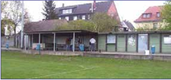
Aus dem Jahr 2002

Seit dem Jahr 2001 bin ich nun Fußballabteilungsleiter und Platzwart beim SCE Gliersmarode und habe alle Höhen und Tiefen in diesem Verein in den letzten 17 Jahren mitgemacht. Ich habe damals die Abteilung mit einer Herrenmannschaft, einer Alte Herrenmannschaft und 4 Jugendmannschaften übernommen. Und so sah es damals aus: