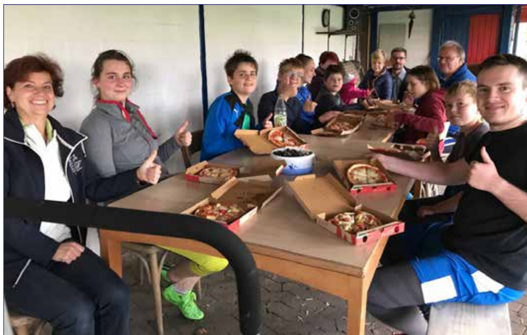
Saisonabschlussfeier der Jugendfußballer

weitere Termine und Informationen unter: www.sce-faustball.de