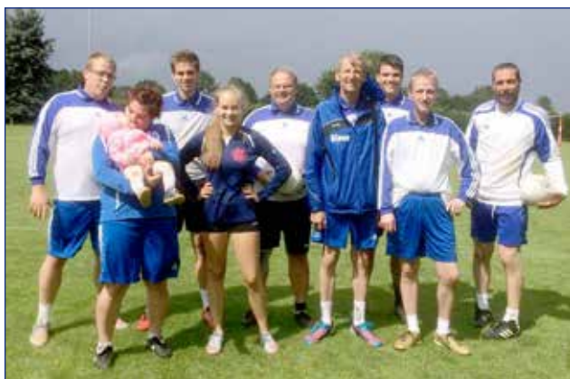
Mit großem Kader nahm der SCE am Turnier in Eicklingen teil