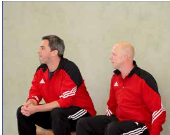
Trainer bei der Arbeit...