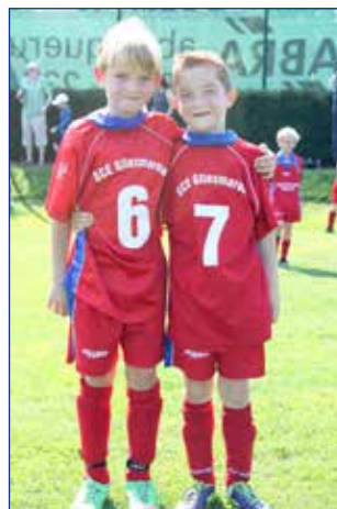
Ob die beiden wirklich alleine auf die Idee gekommen sind oder nicht vielmehr ein Eintracht Fan nachgeholfen hat?