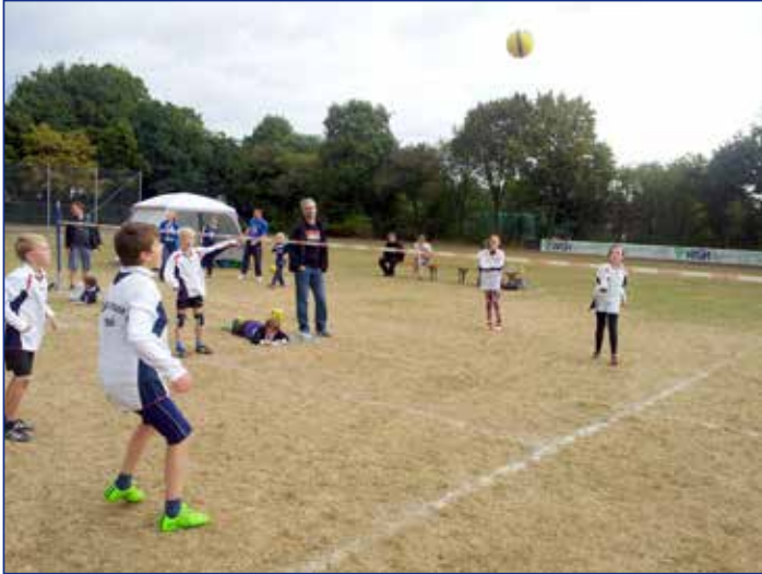
Finale der U10 zwischen den beiden SCE-Teams

Im Rahmen des Turniers des TuS Empelde fanden die Bezirksminimeisterschaften der U8 und U10-Jugendfaustballer statt.