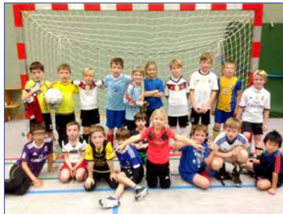
Abgekämpfte F-Jugendfußballer nach dem Training in der Ricarda-Halle