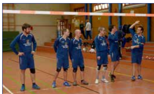
Der dritte Sieg in Folge gelang dem SCE 1 beim Spieltag in Lehre